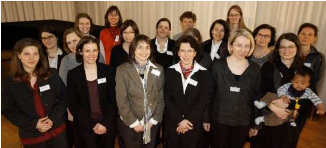
Stipendiatinnen des Margarete von Wrangell-Habilitationsprogramms für Frauen

Beeindruckend für die Zuhörerinnen und Zuhörer war, unter welchen oftmals schwierigen Rahmenbedingungen diese Vereinbarkeit gelingt. An erfolgreichen Wissenschaftlerinnen wie den Referentinnen wurde deutlich, dass weibliches Potenzial in der Wissenschaft vorhanden ist und ihre Kreativität in Forschung und Lehre dringend gebraucht wird. Ein ausgeglichener Frauenanteil bedeutet für die Scientific Community einen unermesslichen Gewinn.