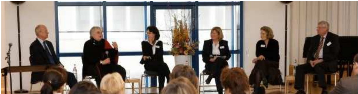
Lebhafte Podiumsdiskussion über „Frauen in der Wissenschaft: Wunsch und Wirklichkeit“